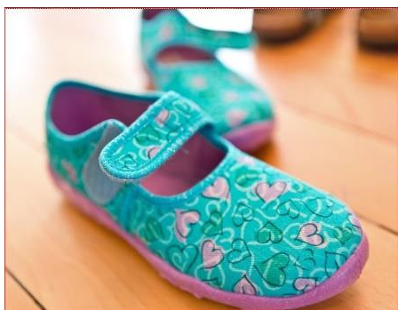
Geschlossene Hausschuhe («Finken»)