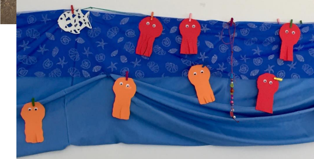
Tintenfische im Meer