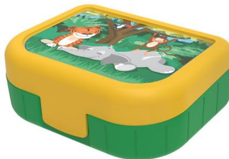
Snack-Box mit «Znüni» / «Zvieri»