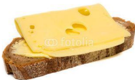
Brot und Käse