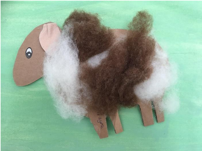
Schaf auf dem Bauernhof