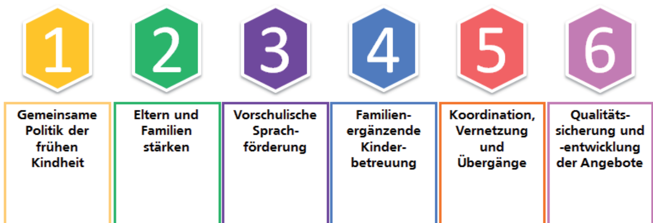
Abb. 7: Übersicht der sechs Handlungsfelder