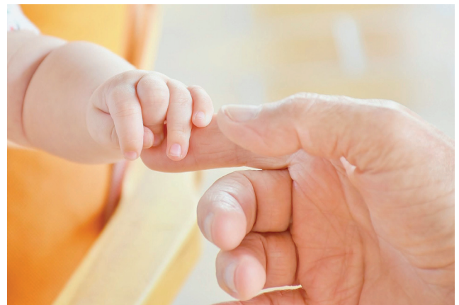
Abb. 2 – 5: Frühe Förderung unterstützt die Entwicklung des Kindes.