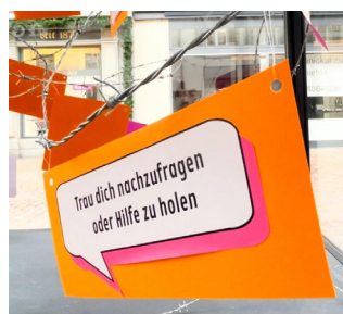
Informationen und Erklärungen im Kunstwürfel in der Altstadt, 2023