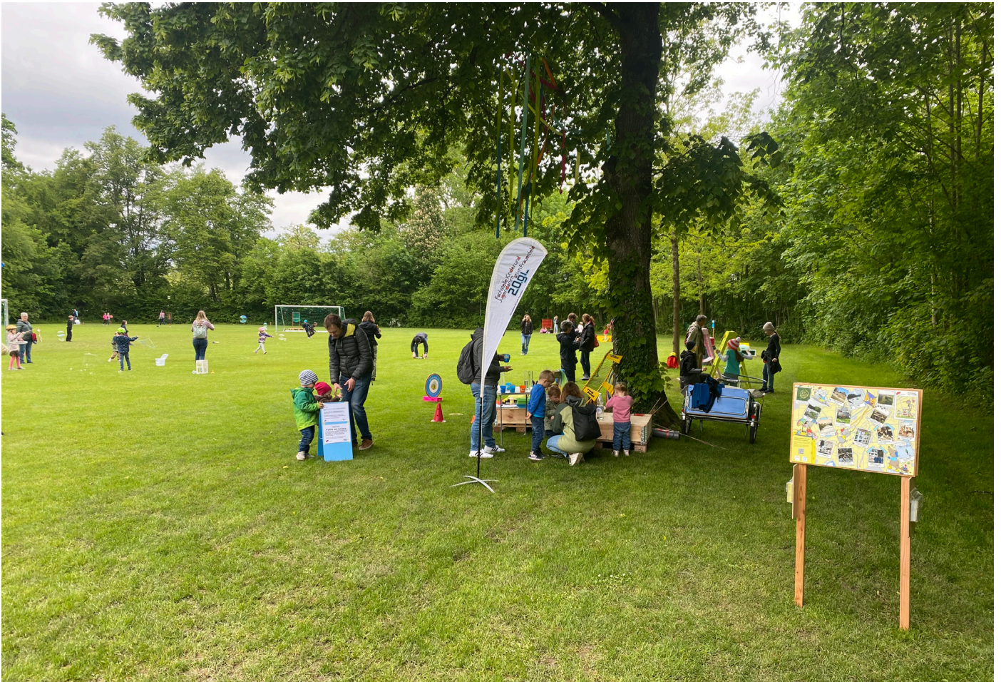
Weltspieltag Mai 2023